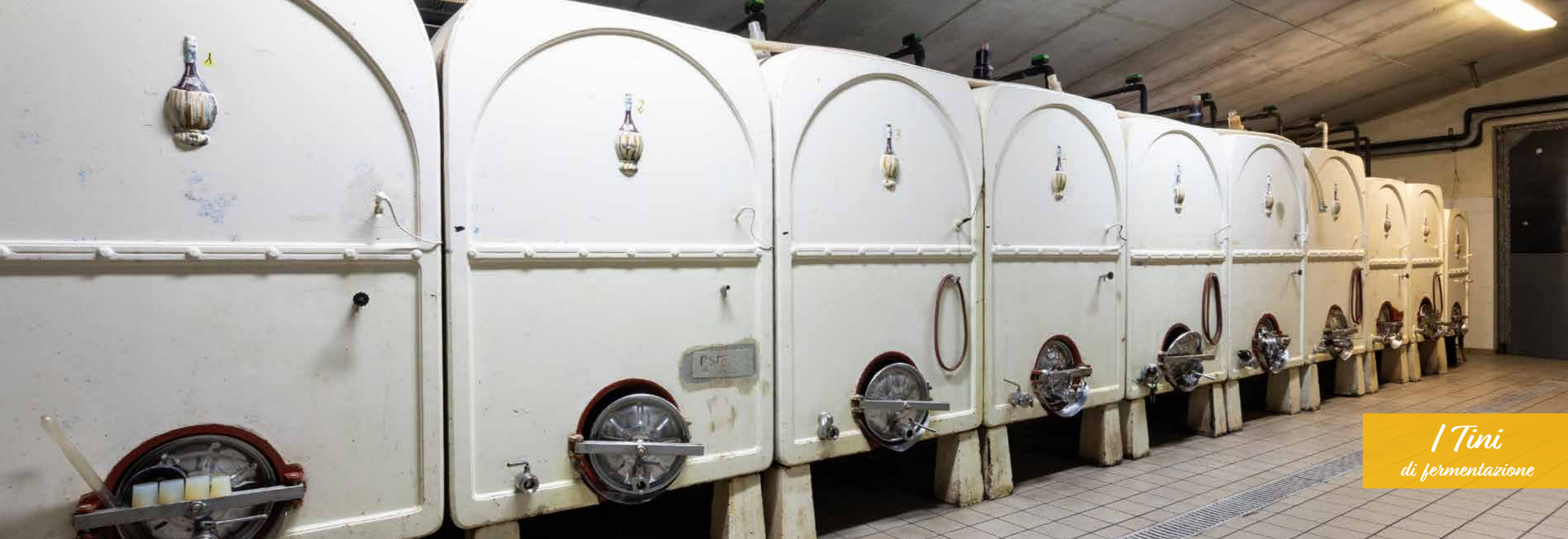
I Tini di fermentazione